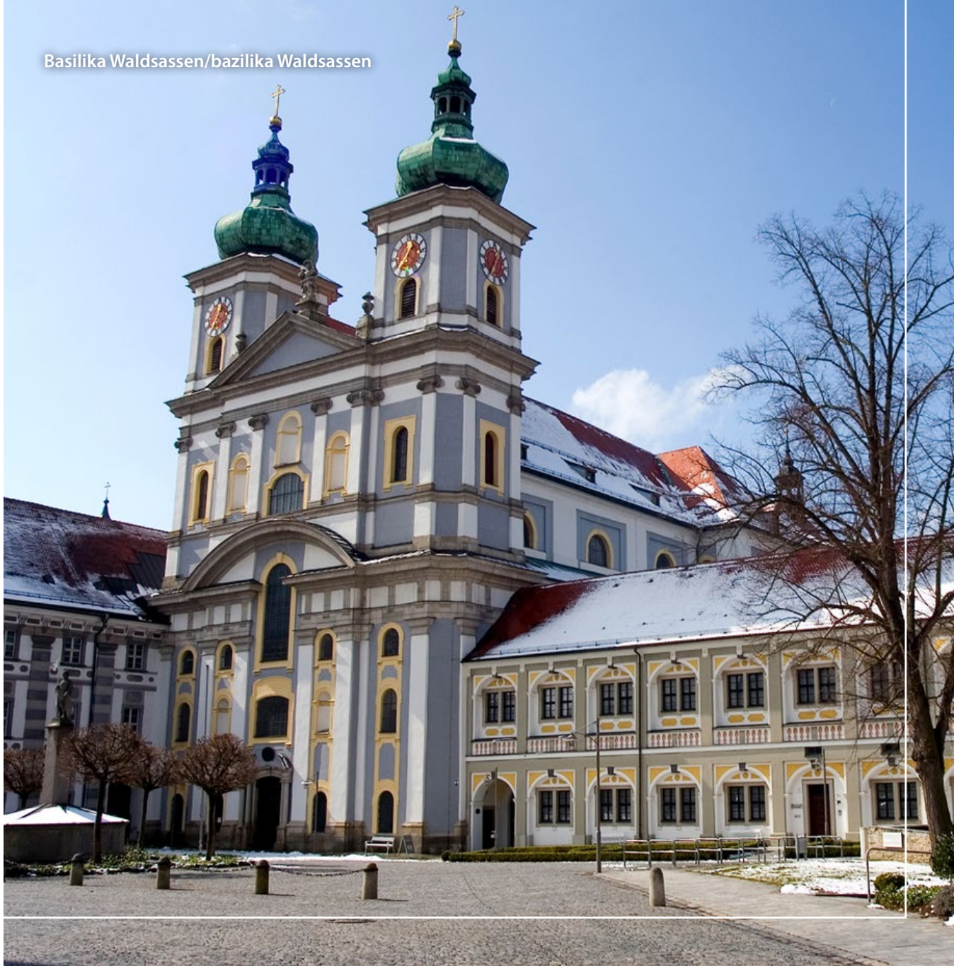
Basilika Waldsassen/bazilika Waldsassen

den Goldsteig Fernwanderweg (Markierung gelbes S) erreichbar. www.steinwald-urlaub.de