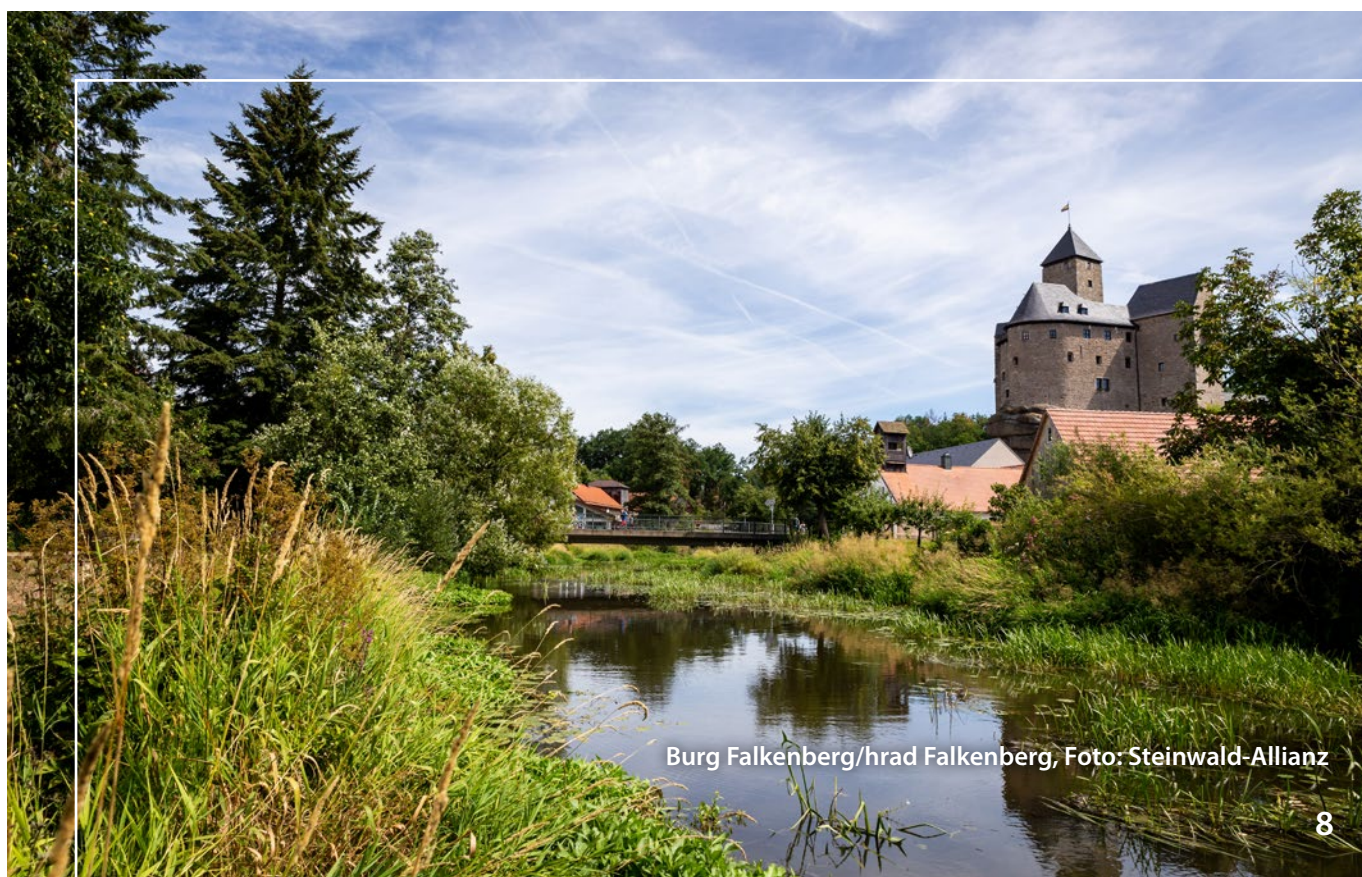
Burg Falkenberg/hrad Falkenberg, Foto: Steinwald-Allianz