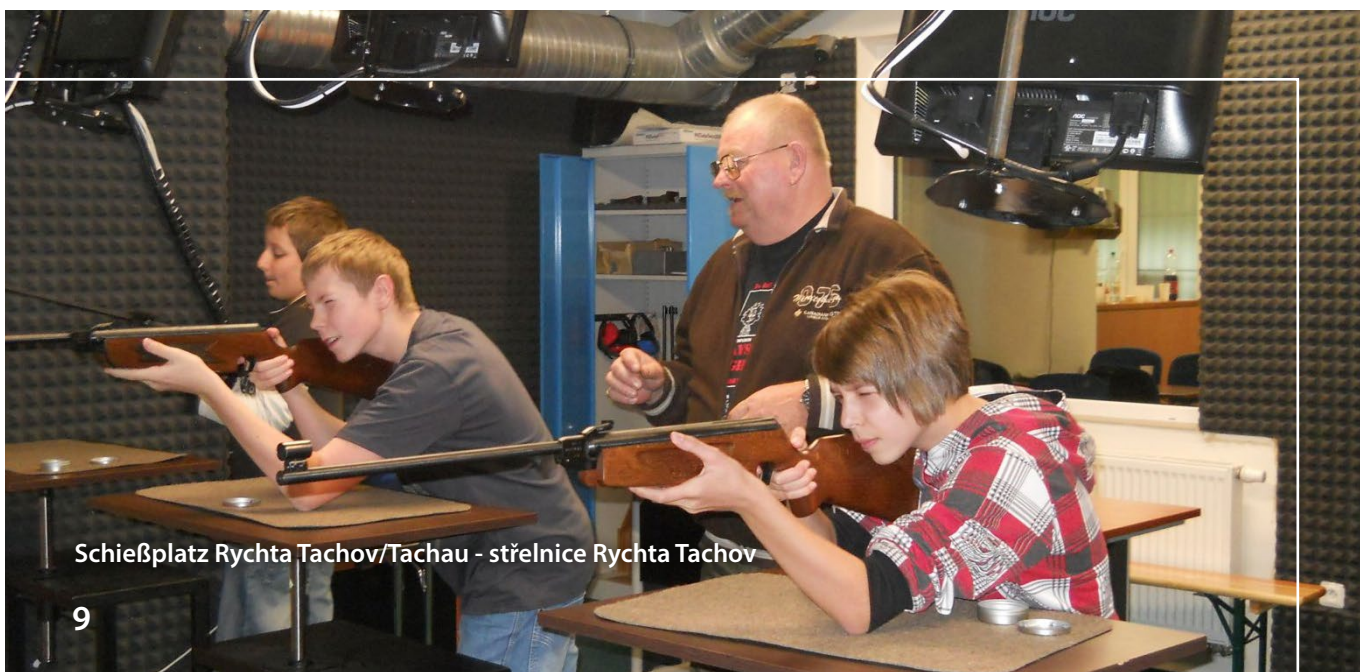
Schießplatz Rychta Tachov/Tachau - střelnice Rychta Tachov