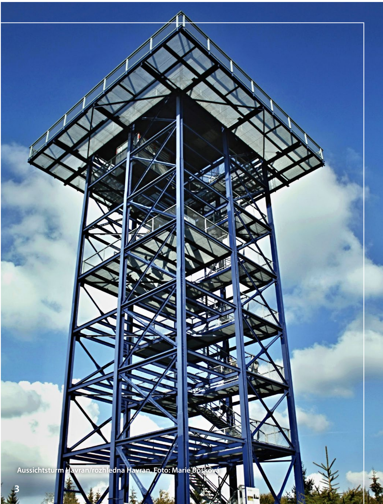
Aussichtsturm Havran/rozhledna Havran