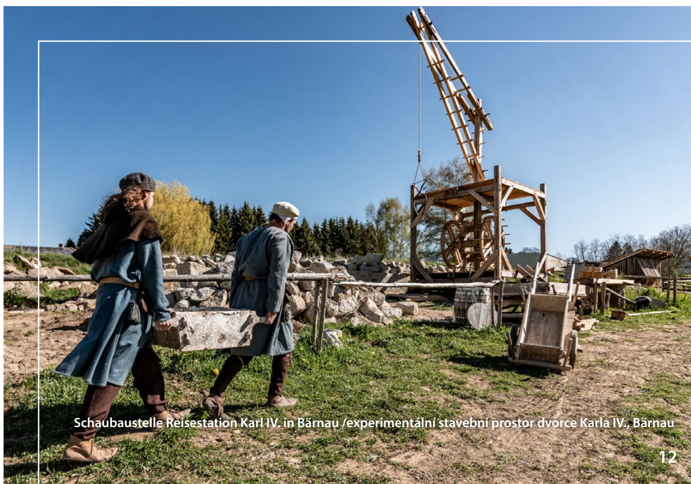
Schaubaustelle Reisestation Karl IV. in Bärnau /experimentální stavební prostor dvorce Karla IV., Bärnau