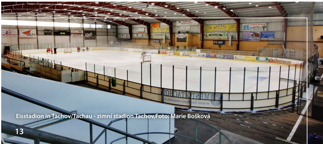
Eisstadion in Tachov/Tachau - zimní stadion Tachov